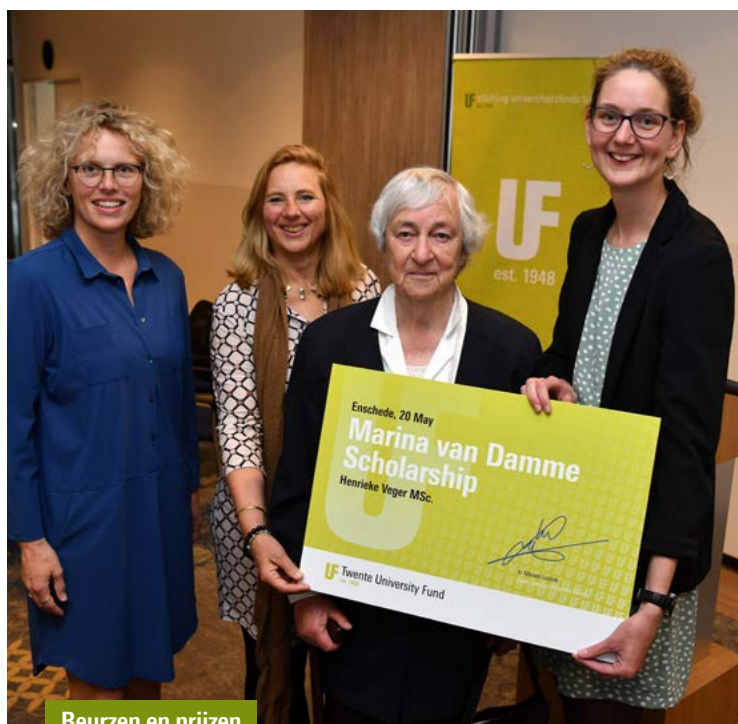
Beurzen en prijzen