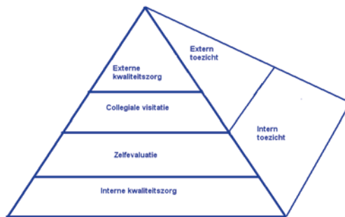
Figuur 2 Model van toezicht en verantwoording

Op de bodem van de piramide vinden we vormen van zelfregulatie en zelfcontrole binnen scholen. De kern daarvan bestaat uit interne kwaliteitszorgsystemen die op scholen worden toegepast. Op dit niveau worden controleactiviteiten uitgevoerd door scholen zelf met het oog op zowel verbetering van het onderwijs als het afleggen van verantwoording aan de omgeving van de school en de hogere geledingen binnen de piramide.