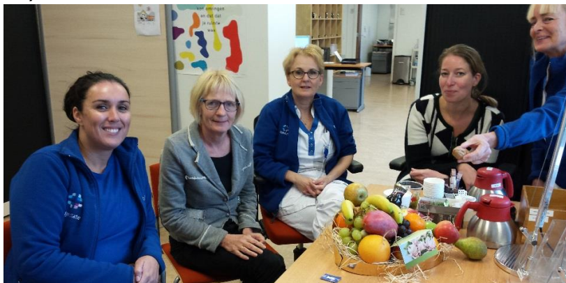
Rijnstate Ziekenhuis Arnhem

Fruitmanden 'Fris en Fruitig van start' – Rijnstate ziekenhuis, Bernhoven ziekenhuis, Medisch Spectrum Twente (september 2016)