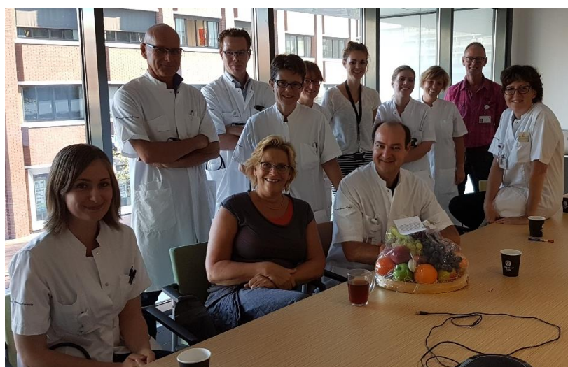
Medisch Spectrum Twente