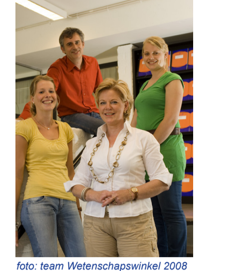
foto: team Wetenschapswinkel 2008

op 13 juni te Tilburg. Ook bouwden wij samen met UT spin-off Student Solutions, aan de landelijke website die wij nu ook beheren.