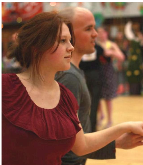
Hanna op het NTDS