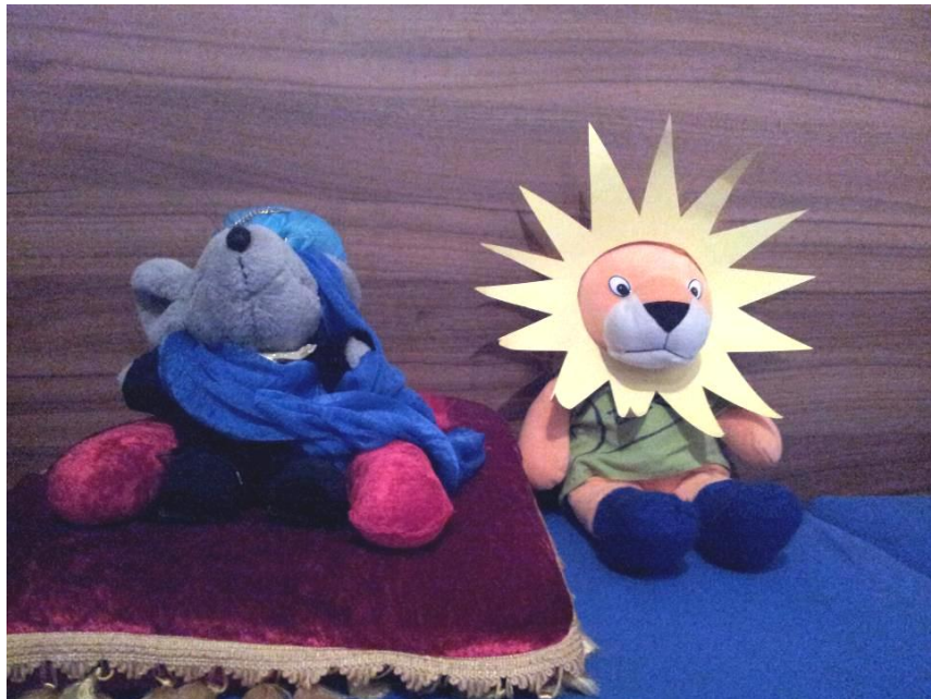
Der Maus en de Leeuw in Enschede!

Tot slot blijft ons alleen nog "SEXY... !!!" en tot in mei met het ETDS hier in Enschede iedereen!