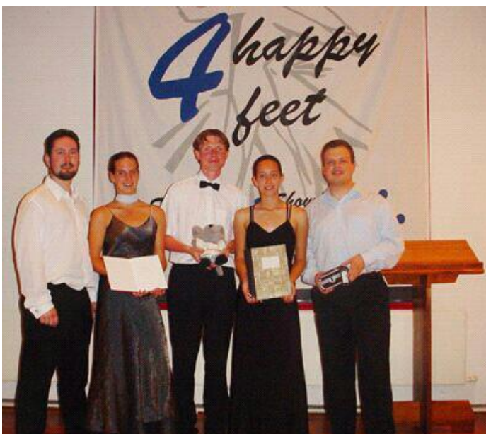
Team Twente in 2003

Sudokuweb.nl Supersudoku - 1 ster - nr 1