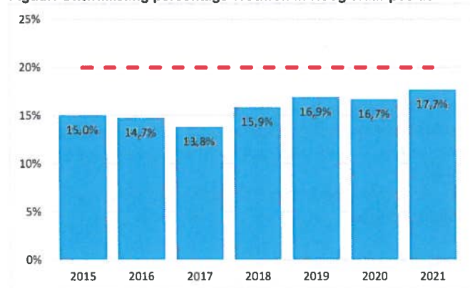
Figuur: Ontwikkeling percentage vrouwen in Hoogleraar positie

Besluit CvB: Het nieuw geformuleerde beleid goed te communiceren. De implementatie van dit beleid te borgen in de P&C-cyclus.