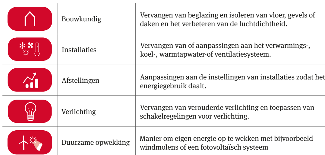
Tabel 1. Categorieën ETM's.

goedbeschermer een specialist heeft om uiteindelijk de ETM's toe te passen.