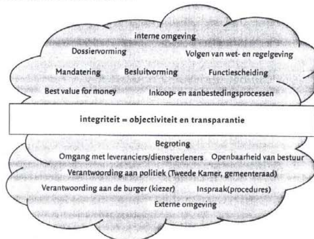
Figuur 1. Het begrip integriteit in de omgeving van een overheidsorganisatie

inhoud in een private onderneming dan in een overheidsorganisatie. Bij deze laatste heeft de maatschappelijke doelstelling grote invloed op de invulling van objectiviteit en transparantie. We willen immers allemaal als burger (=maatschappij) dat de overheid ons belastinggeld doelmatig besteedt (objectiviteit). In figuur 1 is het begrip integriteit geplaatst in de omgeving van een overheidsorganisatie, waarbij onderscheid is gemaakt naar een interne omgeving (de eigen organisatie) en de externe omgeving (de stakeholders buiten de eigen organisatie en in het politieke domein). In de publieke sector richt de verantwoordingsplicht zich op beide aspecten van integriteit, dus zowel op objectiviteit als op transparantie. De Wet dualisering zorgt er bijvoorbeeld voor dat het college van B&W door de gemeenteraad ter verantwoording kan worden geroepen. Daarnaast is in het kader van de Wet Openbaarheid Bestuur veel informatie openbaar en heeft de externe accountant de taak om uitgaven te controleren op conformiteit met bestaande wet- en regelgeving. In de private sector is onder maatschappelijke druk met name de aandacht voor transparantie toegenomen. Niet alleen stakeholders als aandeelhouders en vakbonden, maar ook het bredere