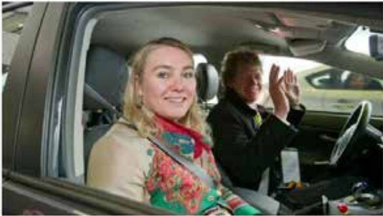
Minister van Infrastructuur en Milieu Schultz van Haagen in een zelfrijdende auto

dinsdag 12 nov. 2013, 15:11 (Update: 22-11-13, 11:42)