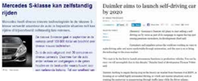
Figuur 4: Persberichten vanuit Daimler over zelfrijdende auto's ( http://www.nu.nl/tech/3477834/mercedes-s-klasse-kan-zelfstandig-rijden.html en http://www.reuters.com/article/2013/09/08/us-autoshow-frankfurt-daimler-selfdrive-idUSBRE98709A20130908 ).

Ook Daimler (zie Figuur 4) liet van zich horen en meldde dat het als doel heeft om tegen 2020 zelfstandig rijdende auto's te lanceren. De Mercedes S-klasse, zoals commercieel verkrijgbaar, kan onder bepaalde omstandigheden nu al zelf rijden