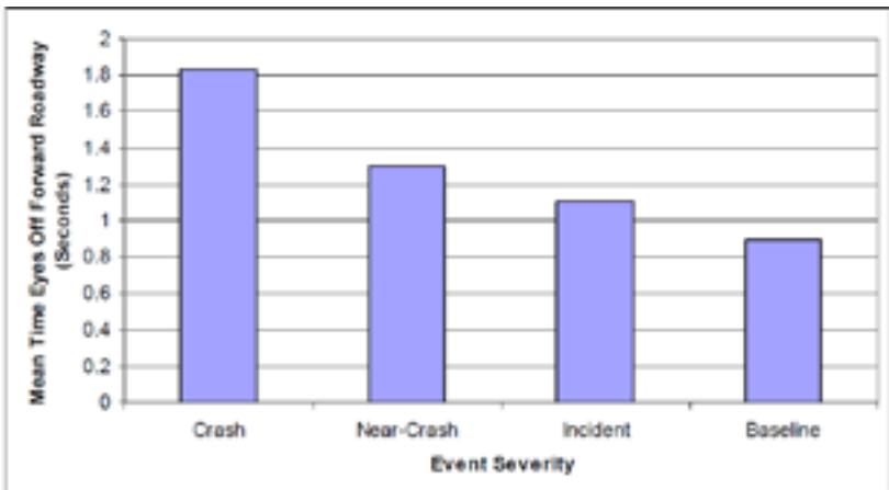
Figuur 13: De totale gemiddelde tijd dat automobilisten hun ogen niet op de weg hadden gedurende de 6 seconden voor een incident of ongeval (Klauer et al, 2006).