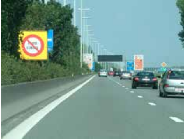
Figuur 15: Borden om mensen te stimuleren op filegevoelige trajecten de Cruise Control uit te schakelen.

Maar niet alleen in dergelijke extreme situaties beïnvloedt CC ons gedrag. Ook in het normale verkeer zijn er, naast het voordeel van een stuk comfort voor de chauffeur onder rustige verkeersomstandigheden, negatieve gedragseffecten gevonden van Cruise Control. Stel iemand rijdt op de middelste rijstrook van de autosnelweg met Cruise Control aan, en rijdt langzaam op de voorligger af, die men eigenlijk wil inhalen. Op dat moment komt er echter iemand op de linkerrijstrook aangereden met een iets hogere snelheid, dus men moet in de middelste rijstrook wachten tot deze auto voorbij is voor men naar links kan gaan. Doordat men de Cruise Control niet uit wil zetten nadert men de voorligger veel dichters dan men zonder Cruise Control zou doen, om op het laatste moment met een veiligheidstechnisch onverantwoord kleine volgafstand snel naar links te gaan. Dit verhoogt tijdelijk het risico op een kop-staart botsing en zorgt ervoor dat men dus anders gaat rijden dan men normaliter zou doen. Ook proberen sommige weggebruikers de CC niet uit te zetten indien ze een bocht doorrijden. Slechts indien men in de bocht echt het gevoel heeft dat het te hard gaat zet men de CC uit en is de snelheid dus een tijdlang hoger dan wanneer men zelf de snelheid zou kiezen.