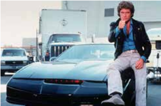
Figuur 12: KITT uit het televisie programma Knight Rider.

Mensen zagen ook dat je je raampje opendraaide en iets wilde vragen, want de meeste mensen die op straat liepen keken voor zich of om zich heen, en niet naar een schermpje tijdens het lopen. Als je pech had met de auto liep je naar een gele praatpaal en riep je de ANWB op. We spraken voor een feestje nog niet af wie er zou rijden, en afleiding in het verkeer bestond alleen nog door rare borden langs de weg, het roken van een sigaret of het wisselen van een cassettebandje in de radiocassettespeler. De meest geavanceerde in-voertuigtechnologie bestond uit cruise control en uit sturen en rembekrachtiging. De enige zelfrijdende auto die er bestond was in eigendom van Michael Knight (zie Figuur 12).