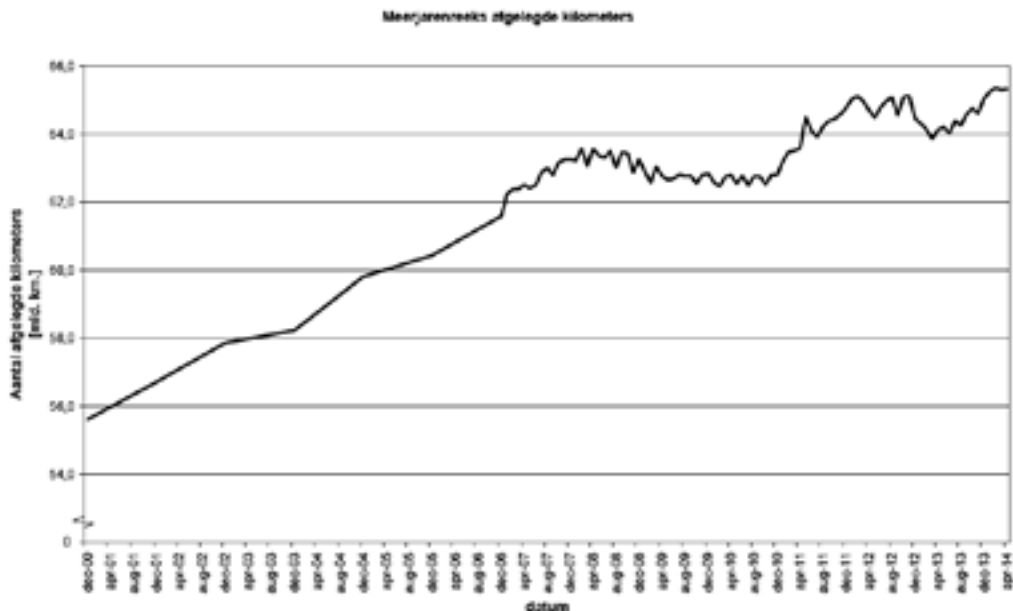
Figuur 11: Ontwikkeling afgelegde kilometers op het Rijkswegennet, uitgezet over de tijd (RWS, 2014b).

Maar hoe verhouden deze cijfers zich dan tot de berichten die ons de afgelopen tijd via de media bereikt hebben waarin een grote afname blijkt van autobezit onder jongeren, en dan met name onder de jongeren onder de 26 (CBS, 2013b)? Helemaal interessant hierbij is dat deze afname in autobezit onder jongeren niet alleen in Nederland aan de gang is, maar dat dit ook gevonden wordt in veel andere landen zoals Zweden, Frankrijk, Australië, de VS en Japan. Deze trend valt niet primair te verklaren door de economische crisis, aangezien een nadere analyse laat zien dat deze trend zich al voor de crisis heeft ingezet. Rest ons wederom de vraag: Zijn we als mens echt aan het veranderen, met andere behoeftes? Hebben jongeren van nu daadwerkelijk minder intrinsieke behoefte aan auto-mobiliteit? 'Liever een iPad dan een auto' werd er al snel in de media van gemaakt. Maar wat blijkt nu uit nader onderzoek van het Kennisinstituut voor Mobiliteitsbeleid? Jongeren kiezen niet voor autoloos, maar voor een auto later (KIM, 2014). Waar het autobezit onder jongeren daalde met 4% is het aantal jongeren dat zijn of haar rijbewijs haalt nog steeds even groot. Jongeren hebben geen andere levenshouding dan een aantal jaren geleden, ze wachten alleen iets