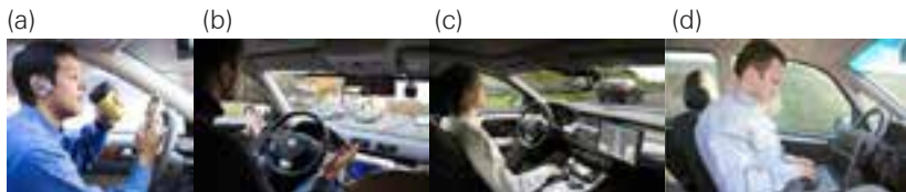
Figuur 9: Voorbeelden van de transitie van manueel naar automatisch rijden

Deze transitie wordt gesymboliseerd in Figuur 9.