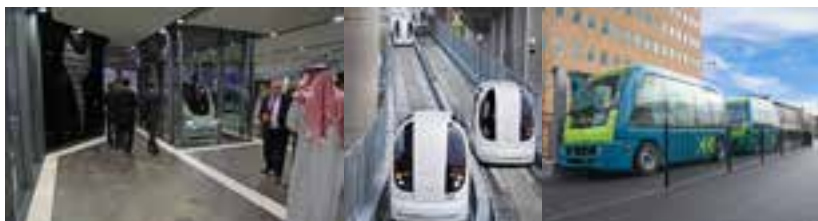
Figuur 3: Van links naar rechts: Abu Dhabi, Heathrow airport, en Kralingsezoom.

In Abu Dhabi bestaat de driverless car, die net als op de luchthaven van Heathrow en op de Kralingse Zoom zonder bestuurder zijn weg vindt en passagiers meeneemt (Figuur 3).