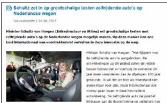
Figuur 6: www.rijksoverheid.nl/nieuws/2014/06/16/schultz-zet-in-op-grootschalige-testen-zelfrijdende-auto-s-op-nederlandse-wegen.html

Maar ook als Nederland staan we regelmatig in de belangstelling met automatische of zelfrijdende auto's. Op 16 juni 2014, de openingsdag van het reeds eerder genoemde ITS Europe congres meldde de minister van Infrastructuur en Milieu Schultz van Haegen dat ze in wilde zetten op het grootschalig testen van zelfrijdende auto's (zie Figuur 6).