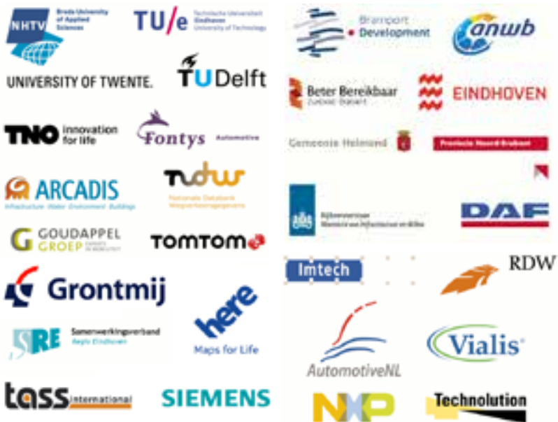
Figuur 18: De partijen die tot het schrijven van deze rede aangesloten waren bij DITCM.

Het grootste Nederlandse initiatief en samenwerking op het gebied van cooperative driving heet DITCM, de Dutch Integrated Testsite for Cooperative Mobility ( www.ditcm.eu ). DITCM is een Nederlands initiatief voor een open innovatie organisatie waarin kennisinstellingen samenwerken met de industrie en de overheid op het gebied van coöperatieve mobiliteit. Rond de 30 partners (zie Figuur 18) werken binnen DITCM samen om kennis te ontwikkelen en vooral ook kennis en data te delen over coöperatieve mobiliteit.