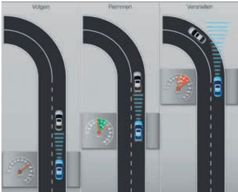
Figuur 16: Mogelijk gedrag van ACC in bochten.

Dit wordt ook wel Sudden Unintended Accelerations genoemd, een onderwerp waar op het Human Factors and Ergonomics Congres hele sessies aan worden gewijd, aangezien dit soort situaties vaker voorkomen dan alleen bij het gebruik van ACC. Sudden Unintended Accelerations staat voor een serie van situaties waarbij de bestuurder, onafhankelijk van de oorzaak het gevoel heeft dat de auto, de term zegt het al, tegen de wil van de automobilist in gaat versnellen. In bepaalde gevallen komt dit doordat men het systeem zelf aan heeft gezet maar het niet aansluit bij de verwachtingen die iemand heeft van het systeem, maar dit kan een verscheidenheid aan oorzaken hebben. In bepaalde gevallen kan er een technisch falen zijn (er worden op jaarbasis vele auto's bij alle bekende automobiefabrikanten terug geroepen vanwege kritische onderdelen of softwarefouten), maar ook menselijke fouten spelen hier wederom een rol. Zoals ik al aangaf, het kan zijn dat men de versnelling niet had verwacht of men zich niet meer realiseert dat de ACC aanstaat, maar ook komt het voor dat als men de voeten een