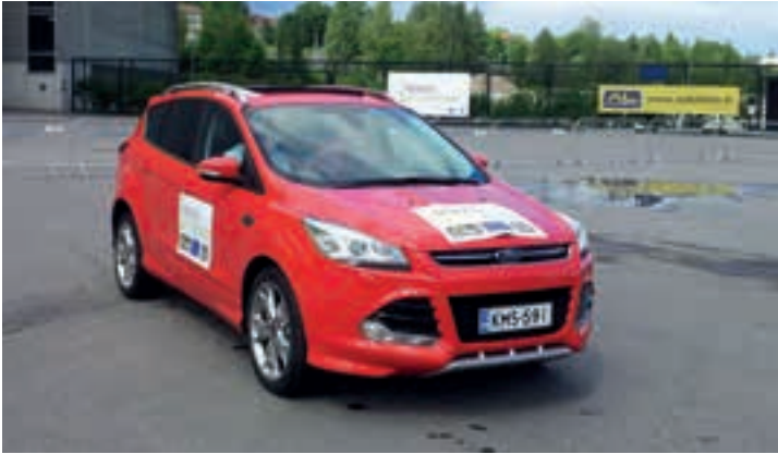
Figuur 1: Ford demo van de Park Assist op ITS Helsinki (2014).

Het feit dat ITS een hot topic is blijkt wel uit het feit dat niet alleen ITS Europe elk jaar druk wordt bezocht, maar dat er zelfs een wereldwijd ITS congres, ITS World, op dit moment voor de 21 e keer plaats vindt. Maar niet alleen vanuit de wetenschappelijke wereld en de ontwikkelende industrie is er veel aandacht voor ITS. Ook vanuit de media is er veel aandacht voor. En terecht, want we staan niet aan de vooravond van een wereld van ongekende mogelijkheden, maar we zitten er al middenin. En het meest tot de verbeelding sprekende onderdeel van ITS is natuurlijk de zelfrijdende auto. Het woord hoeft maar genoemd te worden en de pers duikt er bovenop. Het aantal berichten de laatste jaren over dit onderwerp zijn onnoemlijk. Ik wil hierbij een aantal voorbeelden de revue laten passeren, voor het geval dat u ze gemist heeft.