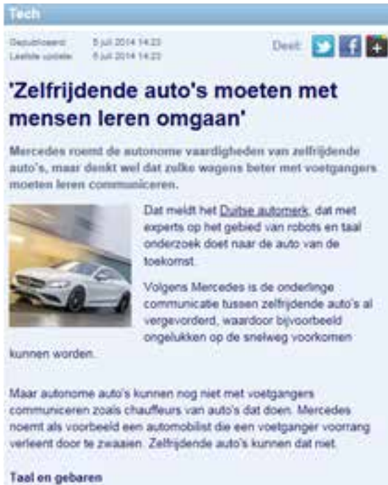
Figuur 19: Bericht van 5 juli 2014 op nu.nl

En zo zijn er nog vele en vele interessante onderzoeksgebieden en thema's waar ik als gedragswetenschapper graag mijn tanden de komende jaren in wil zetten met collega's, AIOs en studenten.