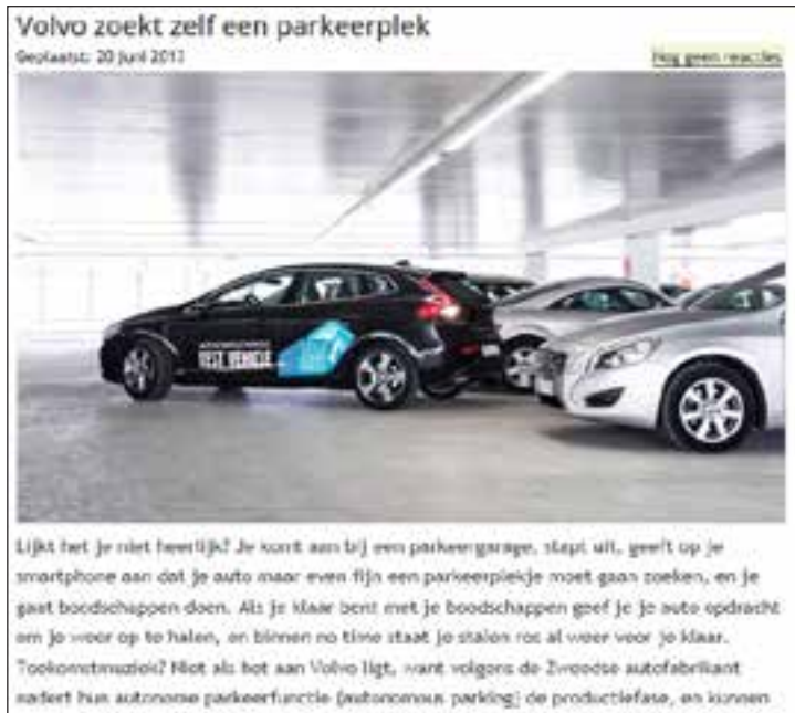
Figuur 2: Zelfparkerende auto's van Volvo ( www.carblogger.nl/volvo-zoekt-zelf-een-parkeerplek/en Audi).

In Abu Dhabi bestaat de driverless car, die net als op de luchthaven van Heathrow en op de Kralingse Zoom zonder bestuurder zijn weg vindt en passagiers meeneemt (Figuur 3).