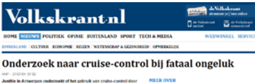
Figuur 14: Krantenkop in de Volkskrant in 2004 naar aanleiding van een fataal ongeval.

rechterstrook 80 rijdt tussen het vrachtverkeer dan is de kans ook groot dat de automobilist aan het bellen of wellicht zijn mail aan het checken is. Voorbij gaan aan de reden waarom men de snelheid terug laat zakken, en het op snelheid houden van een voertuig onafhankelijk van de toestand van de bestuurder blijft helaas niet zonder consequenties. Onder de juiste omstandigheden is CC heerlijk comfortabel en met een alerte bestuurder achter het stuur gaat dit ook prima. Echter, zoals ik u al eerder leerde, de mens is een satisficer, geen optimiser. Dat dergelijke neveneffecten ernstige gevolgen kunnen hebben, hebben we helaas ook in de praktijk gevonden. In 2004, exact 10 jaar geleden stond de rol van Cruise Control bij het ontstaan van ongevallen in de schijnwerpers (zie Figuur 14).