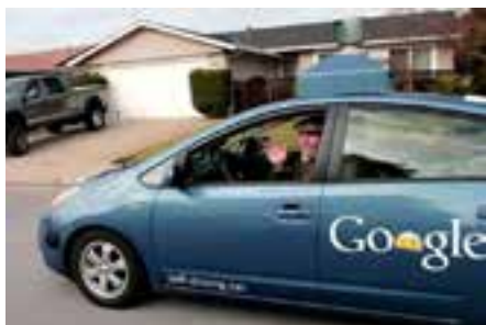
Figuur 5: Google self-driving car

verbeelding sprekende promotiefilmje waarin te zien is dat een blinde man instapt in het voertuig, en blijk geeft van de mogelijkheden die de zelfrijdende auto hem bieden. De Google Self Driving Car riep ook discussie op of we in de toekomst nog wel een rijbewijs nodig hebben als de mens als bestuurder van het voertuig volledig overbodig wordt en of kinderen hier ook zelfstandig mee op pad zouden kunnen..