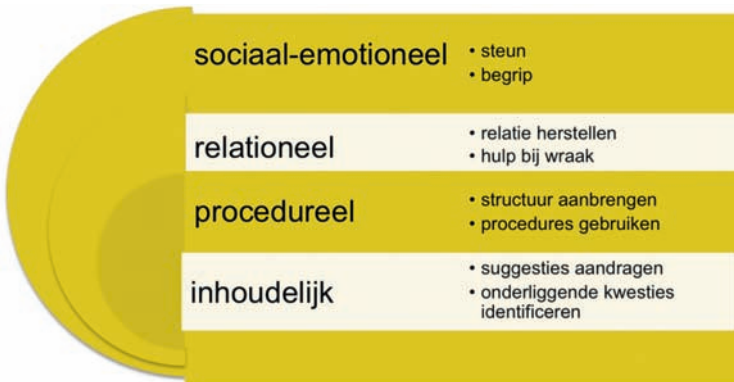
Figuur 4. Behoeften van conflictpartijen richting een derde partij.

slag liggen en de vorm van interventies om bepaald gedrag te veranderen (bijvoorbeeld via folders, verhalen of virtual reality ) te onderzoeken.