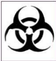
Figuur 10.1 Biologisch risicoteken