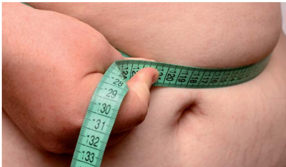
Vrouw met overgewicht. De onderzoekers schetsen de morele controversen die kunnen ontstaan als er een obesitaspil komt, een nog niet bestaand medicijn dat iemand in staat stelt zoveel te eten als hij wil zonder dik te worden.

gaan opvatten, had men daar bijtijds op in kunnen spelen.”