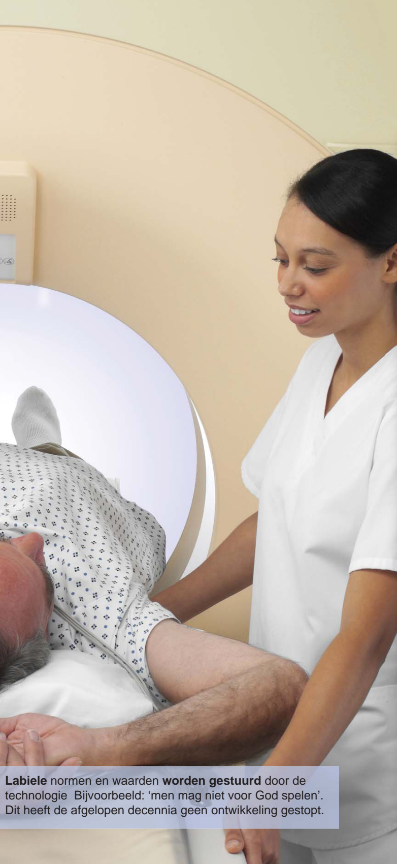
Labiele normen en waarden worden gestuurd door de technologie. Bijvoorbeeld: 'men mag niet voor God spelen'. Dit heeft de afgelopen decennia geen ontwikkeling gestopt.