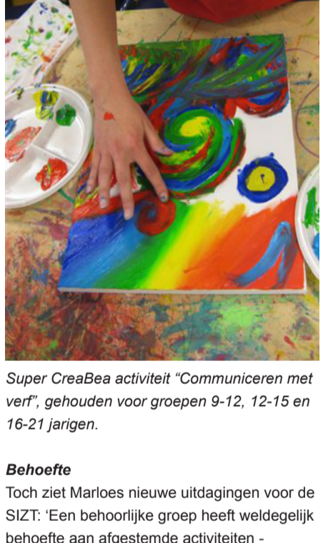
Super CreaBea activiteit 'Communiceren met verf', gehouden voor groepen 9-12, 12-15 en 16-21 jarigen.

De Stichting Informele Zorg Twente (SIZT) organiseert sinds vier jaar spannende activiteiten, zoals uitjes en weekendkampen, speciaal voor jeugdige mantelzorgers. Daarmee vervult de SIZT een pioniersrol in Nederland. De jongeren, tussen de vier en 21 jaar oud, hebben thuis te maken met een zorgsituatie, bijvoorbeeld van een (chronisch) zieke ouder. Ook lichamelijk of geestelijk gehandicapte gezinsleden of psychiatrische of verslavingsproblematiek, kunnen maken dat ze thuis al op jonge leeftijd extra zorgtaken krijgen en speciale, vaak 'volwassen', verantwoordelijkheden op zich nemen.